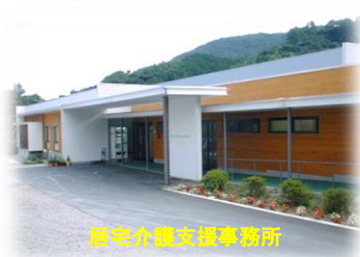
居宅介護支援事務所