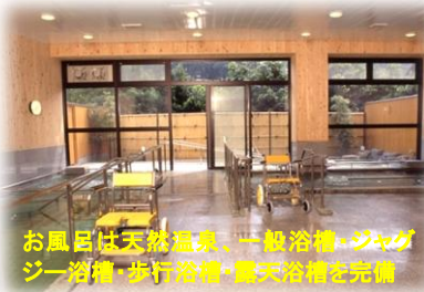
お風呂は天然温泉、一般浴槽・ジャグジー浴槽・歩行浴槽・電気浴槽を完備