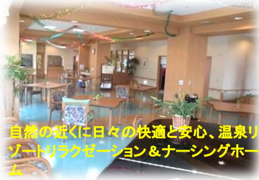
自然の近くは日々の快適と安心、温泉リゾートリラクゼーション&ナーシングホーム